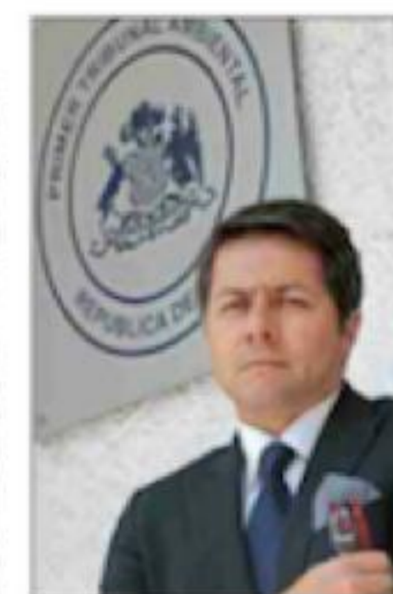
Guevara recordó que el recurso de Andes Iron tiene 40 mil fojas.

Guevara afirmó que "la madurez de una persona para llegar al cargo de una judicatura está basada precisamente en que sepa separar la paja del trigo, y que evite colar el mosquito y dejar