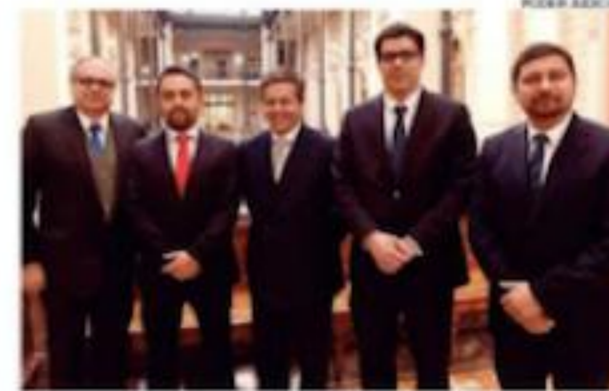
LOS NUEVOS MINISTROS TRAS LA CEREMONIA EN LA CORTE SUPREMA.