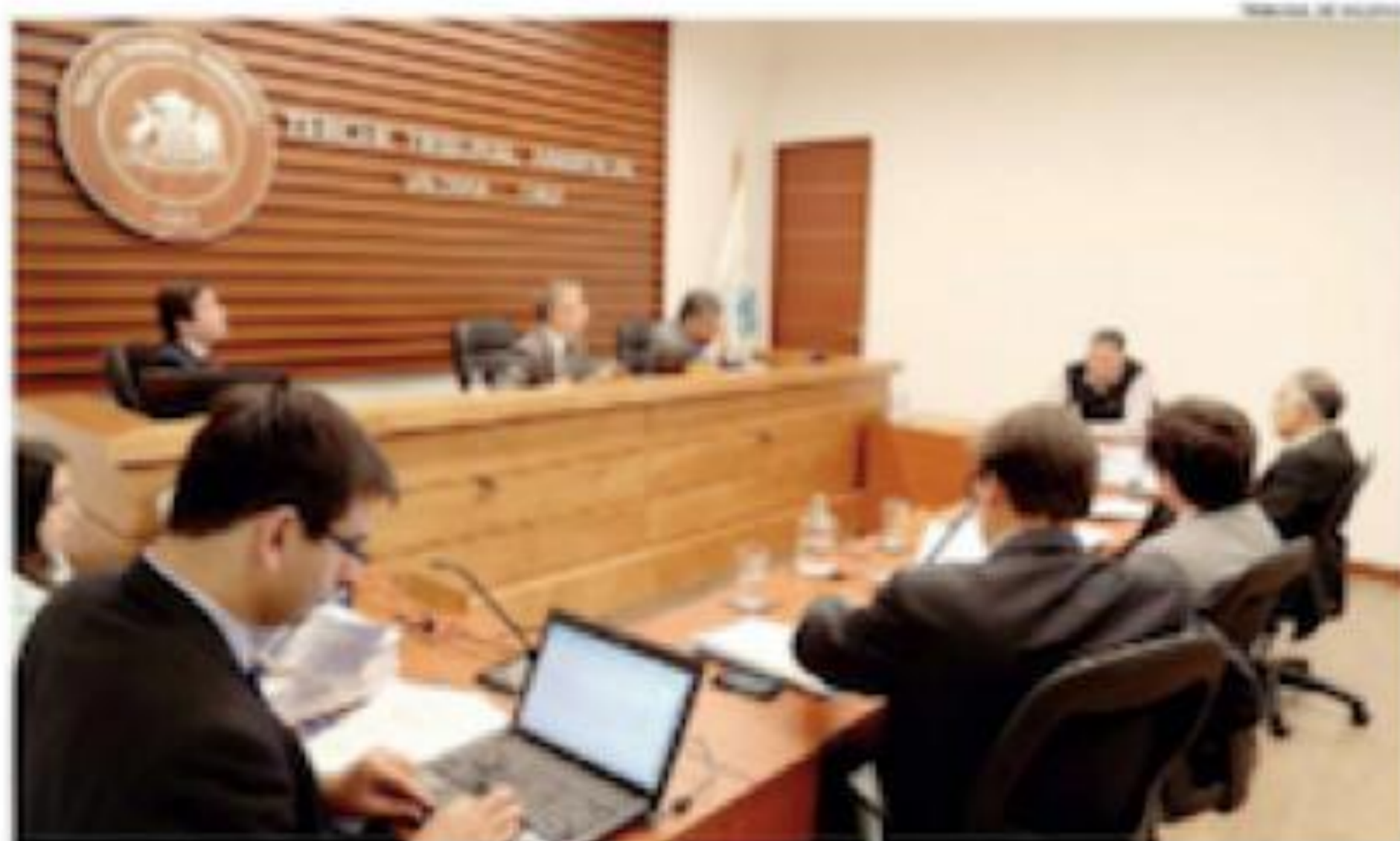
LA LEY 20.600 CREÓ LOS TRIBUNALES AMBIENTALES EN BIOL, PUNTA, LOS CÁNDAROS, GUAYAMA, PARRAL, SANTIAGO, VALDIVIA Y ANTOFAGASTA.

En un plazo de 90 días, contado desde el momento en que se publicaron sus respectivos nombres, se espera que los jueces ambientales de Antofagasta comiencen la instalación del nuevo tribunal regionalizado.