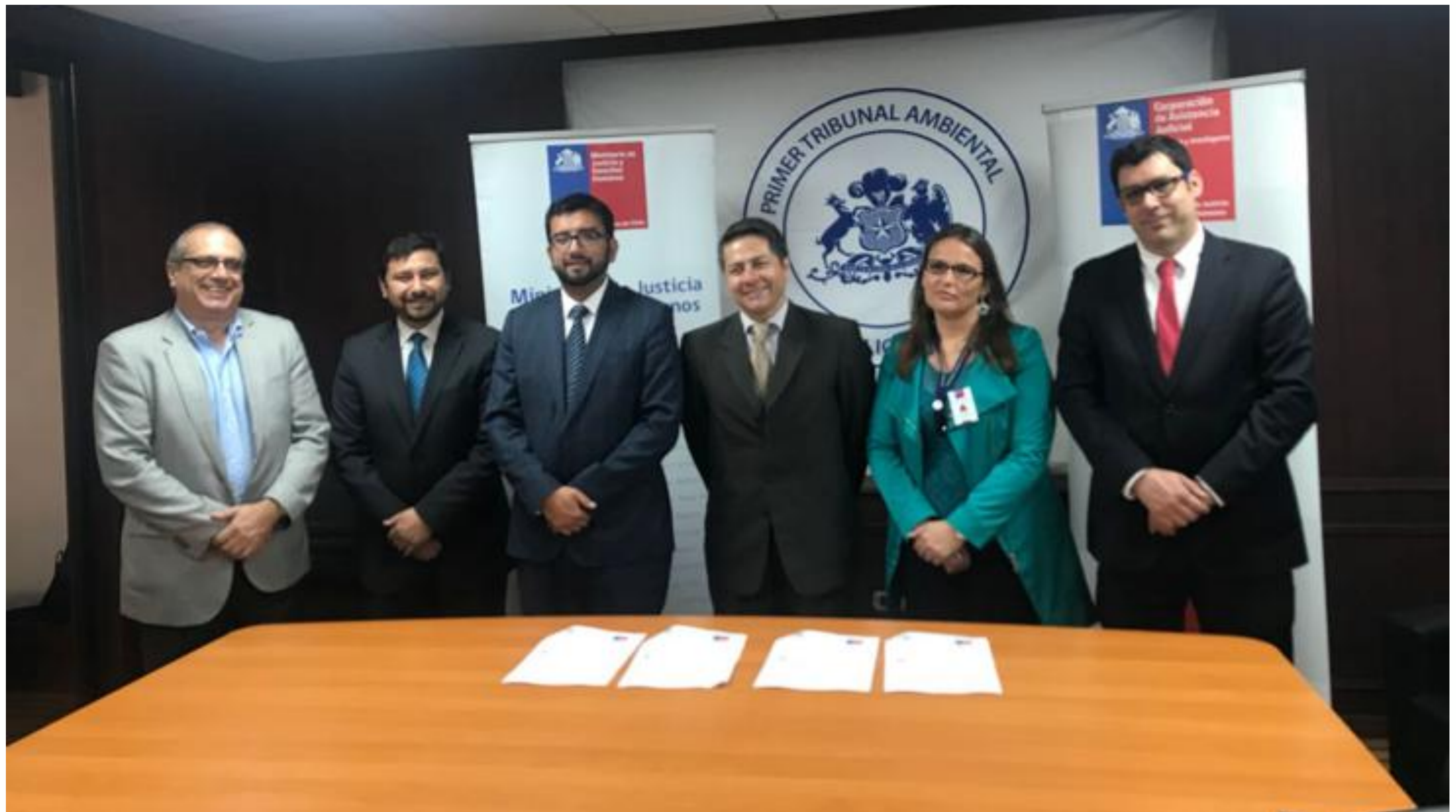
Primer Tribunal Ambiental suscribe convenio con la PUC para fomentar intercambio de conocimiento