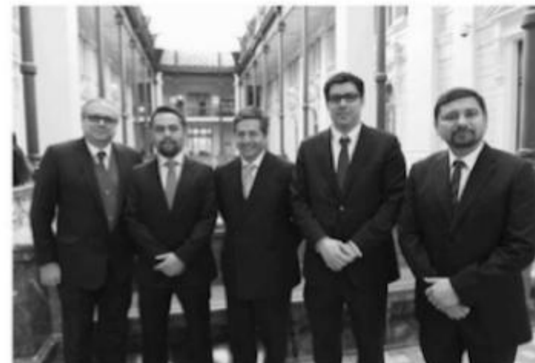
LOS INTEGRANTES DEL TRIBUNAL AMBIENTAL DE ANTOFAGASTA.